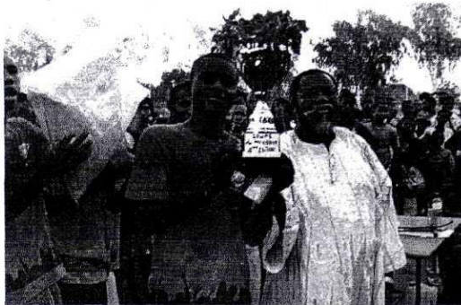
Le capitaine de la 1re D1 a reçu son trophée des mains du proviseur

L'édition 2011 de la Coupe du proviseur du lycée municipal Vinama Tiémounou Djibril (LMVTD) a connu son épilogue le 28 mai 2011 sur le terrain de l'établissement. La finale qui s'est jouée en présence des premiers responsables de l'enseignement secondaire de la ville ainsi que de nombreux invités a été remportée par la 1re D1. C'était à l'issue d'un match très disputé et parrainé par la société Lydia Ludic S.A.