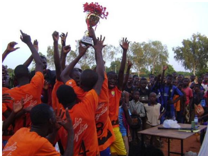
Les gagnants célébrant la victoire

Article du quotidien L'Observateur Paalga du 9 juin 2011 ci-après : « La 1 re D1 succède à la 2 nde C1 ».