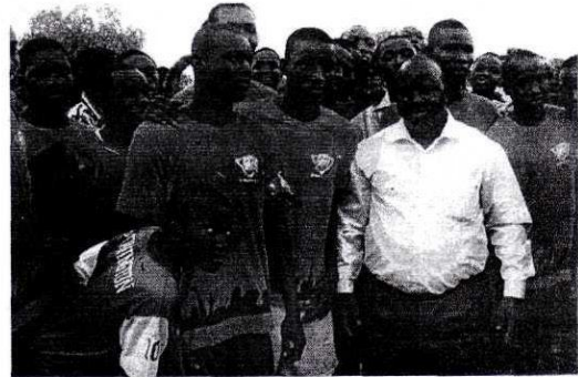
Le directeur régional de Lydia Ludic partageant la joie du vainqueur