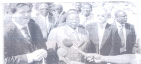
Le ministre Kpabré-Sylli : « nous apprécions à sa juste valeur ce projet qui renforcera notre capacité d'hébergement ».