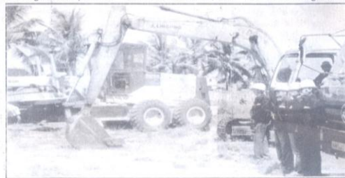
Bulldozers et autres engins en pleine activité à l'issue de la cérémonie.