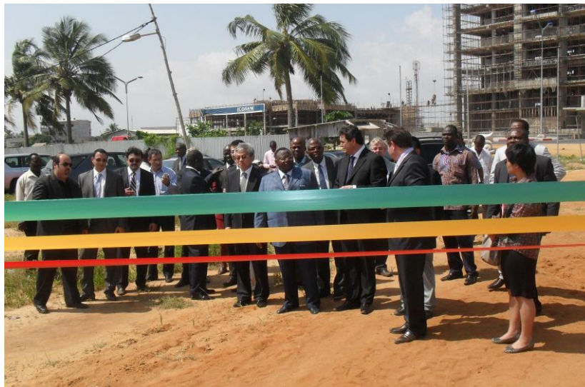
Photo de l'évènement

Article du quotidien Togo Presse du 26 novembre 2010 en page suivante: « Bientôt un hôtel 5 étoiles haut standing du groupe PEFACO sur la côte de Lomé ».